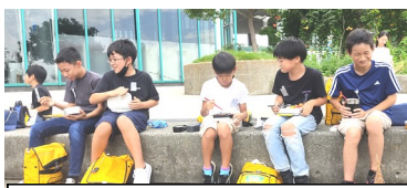
「おいしい〜」楽しいお弁当の時間!

全学年、9月に社会見学を実施しました。朝の校門での挨拶、見学に行く学年の子ども達は、どの子も挨拶の声が大きくなり、さらには満面の笑顔で「校長先生、行ってくるわ!」と、何人も楽しそうに声をかけてくれました。